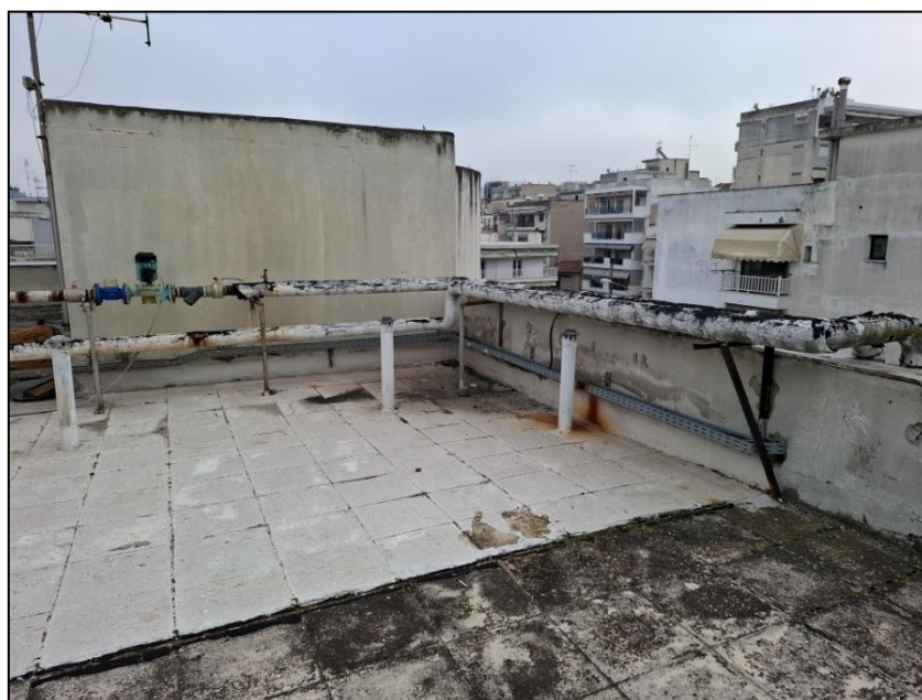
Εικόνα 2. Στηθαία δώματος