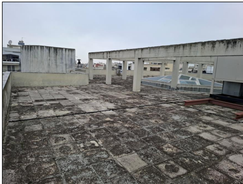
Εικόνα 1. Δώμα Τοπικού Ιατρείου Βότση Κ.Υ. 25 ης ΜΑΡΤΙΟΥ