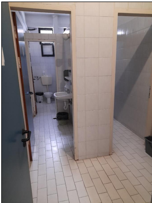
Εικόνα 4. Χώροι υγιεινής προσωπικού