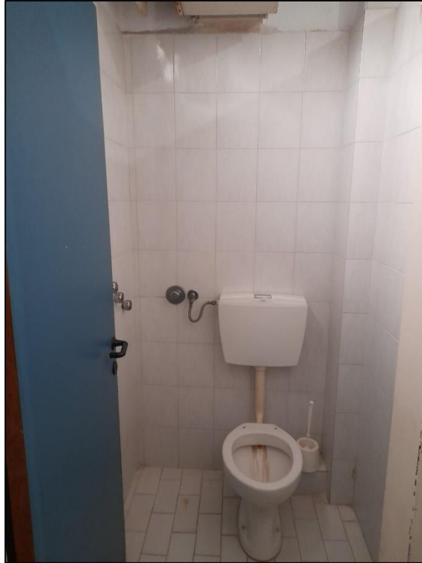
Εικόνα 6. Χώροι υγιεινής κοινού